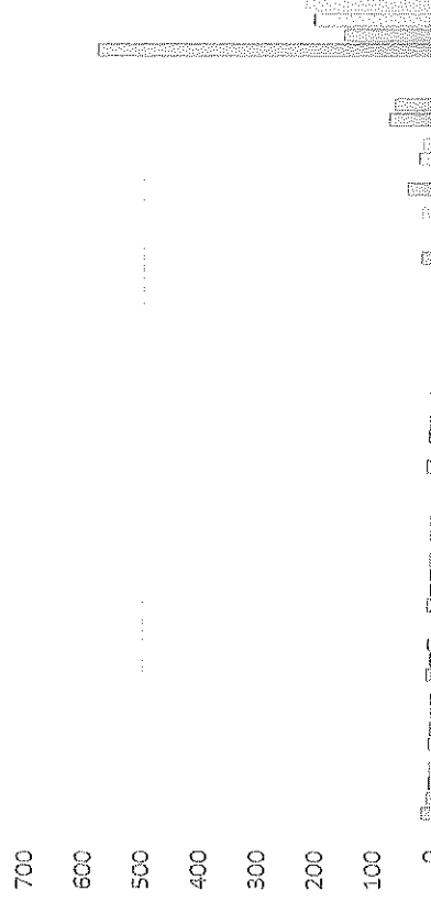
OCTUBRE- DICIEMBRE 2021

EXPEDICION DE CONSTANCIAS DE IDENTIDAD EXPEDICION DE CONSTANCIAS DE DOMICILIO EXPEDICION DE CONSTANCIA RESIDENCIA EXPEDICION DE CONSTANCIA RESIDENCIA-PARTO EXPEDICION DE CONSTANCIA RESIDENCIA TRASLADO DE VIVIR... CERTIFICACIONES DEPENDENCIAS PARA CIUDADANOS FOJAS DE LAS CERTIFICACIONES ASISTENCIA A SESIONES DE CABILDO ELABORACION DE ACTAS DE SESIONES COMISION A REUNION DE GOBIERNO REUNION EN COMUNIDADES PARA ELECCION DE AGENTES REUNION EN COMUNIDADES PARA ELECCION... COMISION A REUNION DE GOBIERNO ELABORACION DE ACTAS DE SESIONES ASISTENCIA A SESIONES DE CABILDO FOJAS DE LAS CERTIFICACIONES CERTIFICACIONES DEPENDENCIAS PARA ELECCION DE AGENTES REUNION EN COMUNIDADES PARA ELECCION DE AGENTES